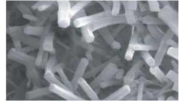
โครงสร้างเส้นใย

วิธีที่ 1 : น้ำ + PORTLAND + ทราย ดิน + ปูน → ใช้ หรือ วิธีที่ 2 : ผสมผงทั้งหมดให้เสร็จ + น้ำ → ใช้